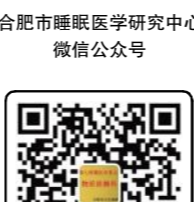
“合肥市睡眠医学研究中心”微信公众号