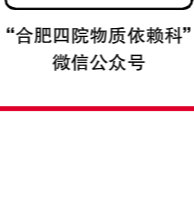
“合肥四院物质依赖科”微信公众号