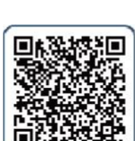
“合肥四院(安徽精卫中心)”快手号